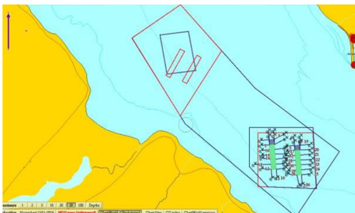
Mynd 3. Mynd sem sýnir stækkun eldissvæðisins við Kvígingisdal (bláar línur) þannig að það nær yfir svæðið við Háanes (Rauðar línur). (Úr innsendum gögnum Arctic Sea Farm í september 2021).