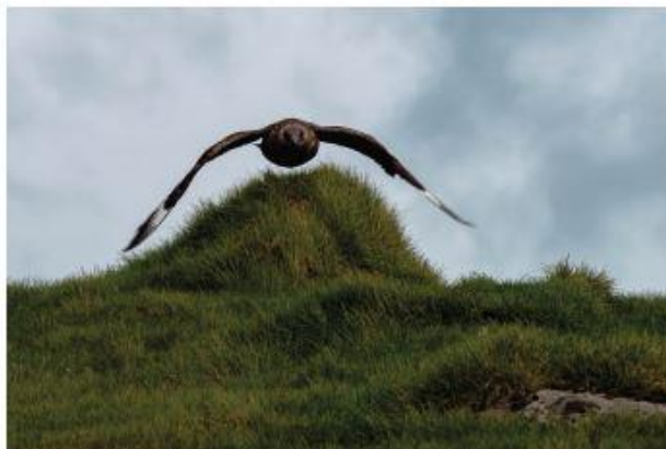
Skúmur í árásarhug (ljósmynd APS 2018).

Á heimasiðu Örafæferð ehf. eru einnig auglýstar ljósmyndaferðir 6 sem farnar eru einu sinni til tvisvar í viku kl. 6:45 í þrjár klukkustundir. Hámarksfjöldi ljósmyndara í ferð eru tíu manns. Brýnt er fyrir ljósmyndurum á heimasiðunni að sýna fuglum tillitssemi s.s. með því að dvelja ekki lengi við hreiður og að allir ljósmyndarar verða að vera í sjónmáli við leiðsögumann allan tímann og að hlýða því þegar hann segir þeim að færa sig úr stað. Kynningaefni á heimasiðunni með leiðbeiningum um hegðun er til fyrirmyndar og það sem höfundur sá til leiðsögumans og starfsfólks bendir til að vel sé hugað að því að draga úr áhrifum ferðamanna á fuglalíf og náttúru svæðisins. Því ætti ferðaþjónusta með núverandi fyrirkomulagi að geta starfað áfram án teljandi áhrifa á fuglalíf og náttúru Ingólfshöfða.