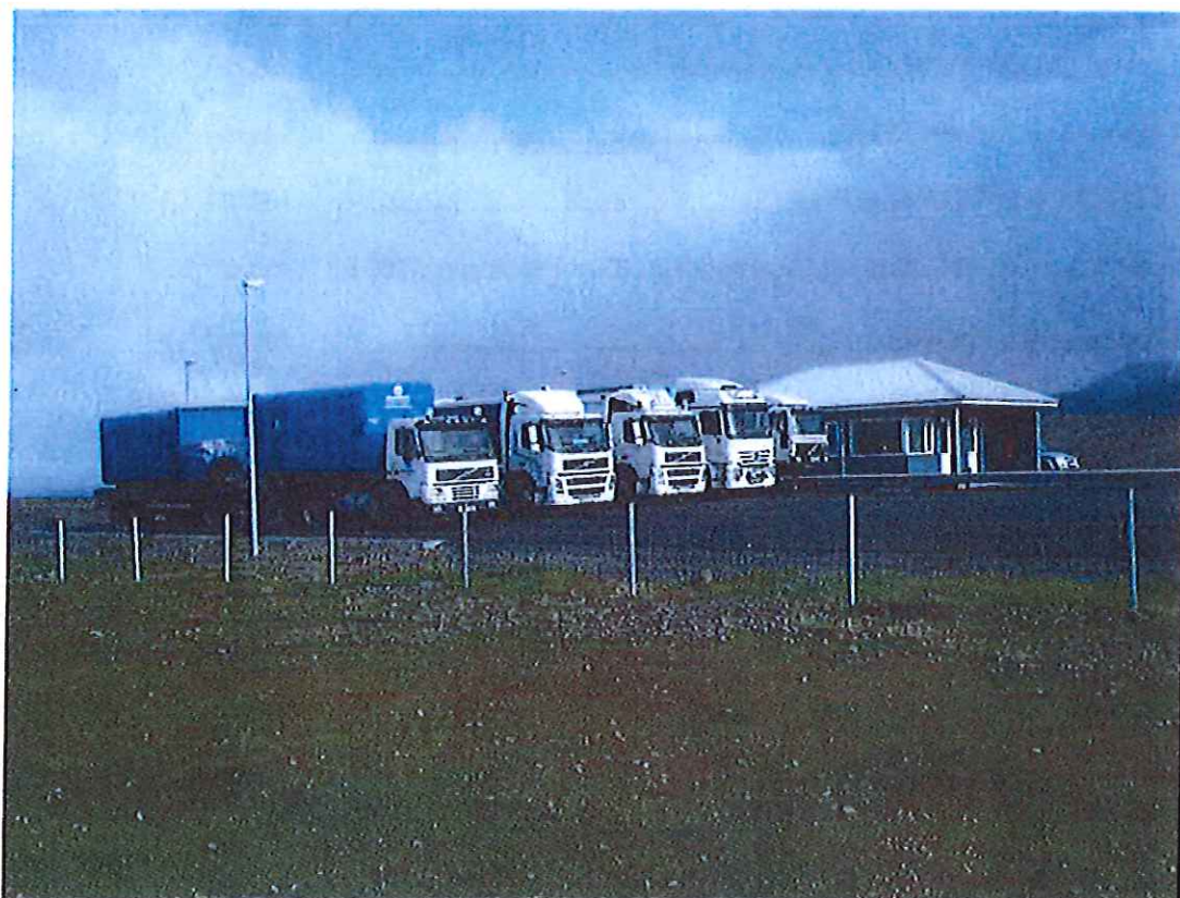
Mannamót í aðstöðuhúsi í Stekkjarvík.