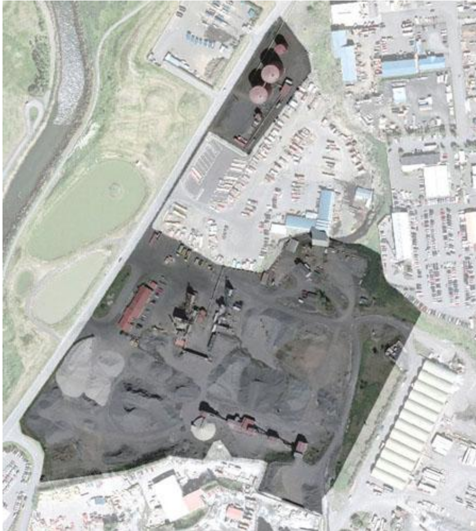
Mynd 1. Yfirlitsmynd af athafnasvæði fyrirtækisins við Sævarhöfða 6-10.

Fyrirtækið er staðsett við Sævarhöfða í Reykjavík, við ósa Elliðaáa, sjá mynd 1. Helstu nágrennar eru steypustöð, bílasala, vörubílastöð, Sorpa og Björgun hf. Ofan fyrirtækisins eru lagergeymslur Reykjavíkurborgar. Næstu íbúðahverfi eru Ártúnsholt handan Vesturlandsvegjar, Vogahverfið handan Elliðavogjar og Bryggjuhverfið handan Ártúnshöfða. Starfsemin fer að mestu fram á Höfuðborgarsvæðinu hvað útlögn malbiks varðar, en einnig hefur fyrirtækið tekið að sér verkefni á mun stærra svæði og má segja að mörkin í dag liggja við Skeiðarársand í austri og Blönduós í A-Húnavatnssýslu í norðri.