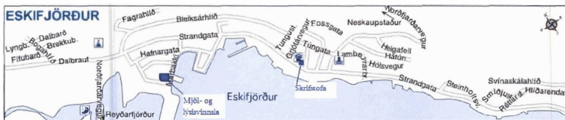
Mynd 1 Yfirlitsmynd af Eskifirði

Mjöl- og lýsisvinnsla Eskju er staðsett á Marbakka sem er iðnaðarsvæði á Eskifirði og skrifstofa fyrirtækisins er staðsett í miðjum bænum líkt og mynd 1 sýnir.