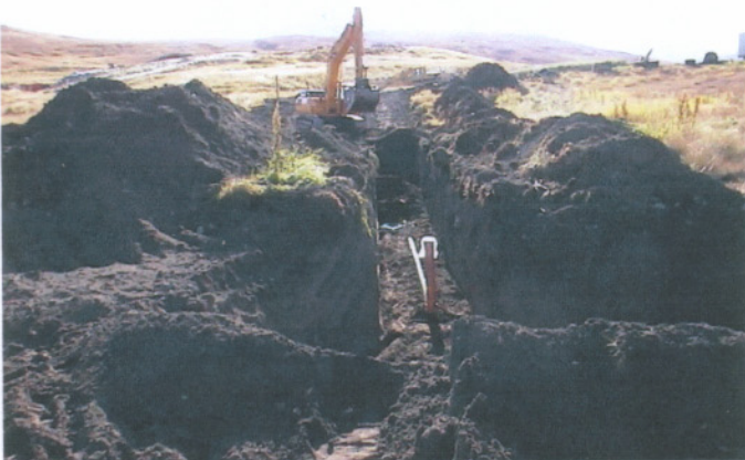
Endurnýjun á siturlögn frá urðunarstaðnum, sept. 2004

Í öllum tilvikum er um að ræða dælingu í 5 mín. nema í holu 1 árið 2003, þar stóð dælingin yfir í 15 mín.