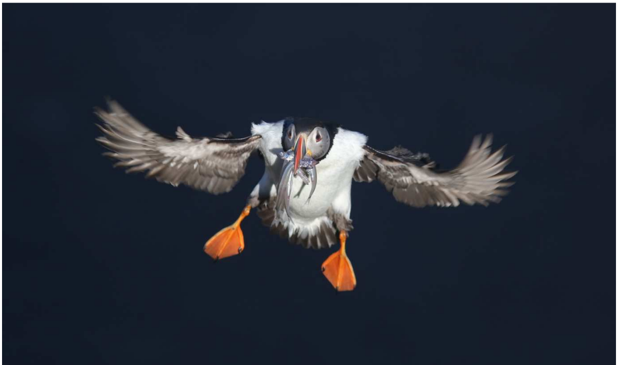
Lundi að bera fæðu í unga í júlí 2016 í Hafnarhólma, Borgarfirði Eystra.