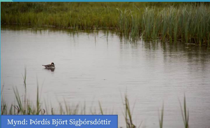
Mynd: Þórdís Björt Sigþórsdóttir