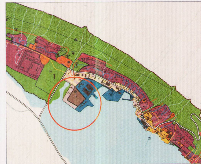
Aðalskipulag Fjarðabyggðar 2007-2027 Þéttbýlisuppdráttur fyrir Eskifjörð