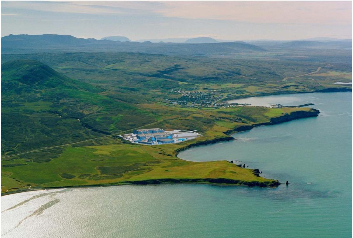
Mynd 2 Líkan af kísilmálmverksmiðju PCC BakkiSilicon á Bakka við Húsavík, yfirflugsmýnd úr norðri.