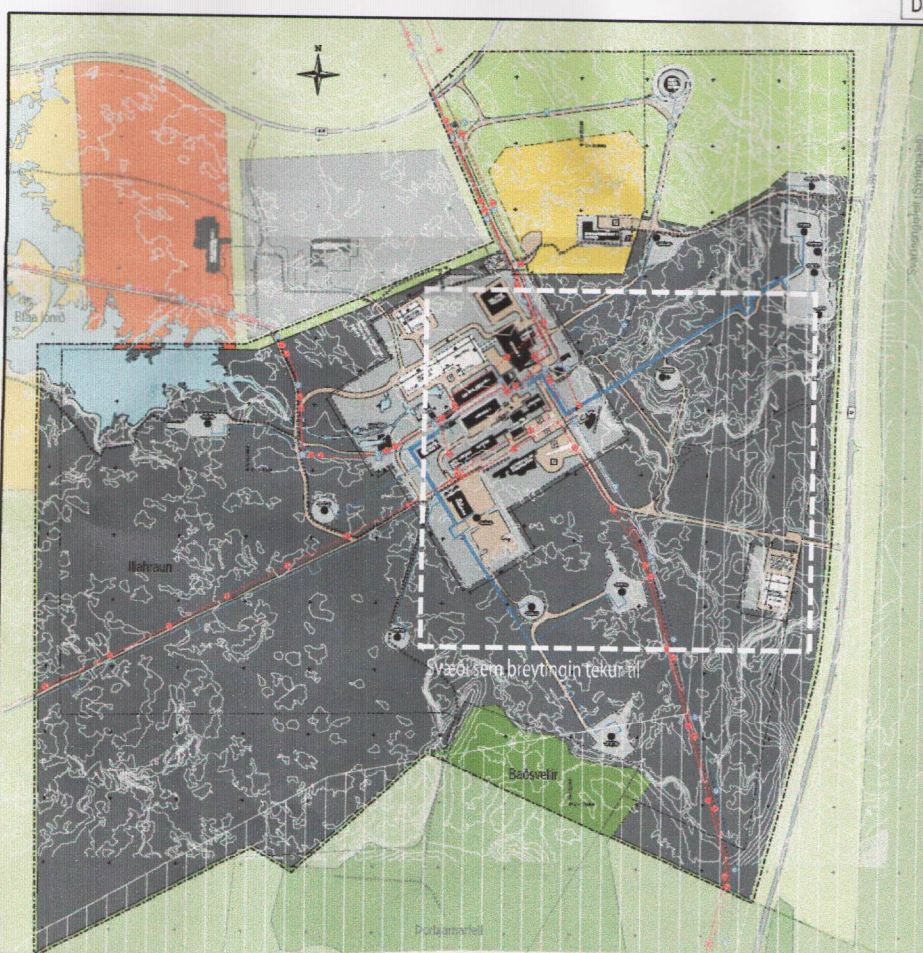
Deiliskipulag í gildi - Yfirlitsmynd