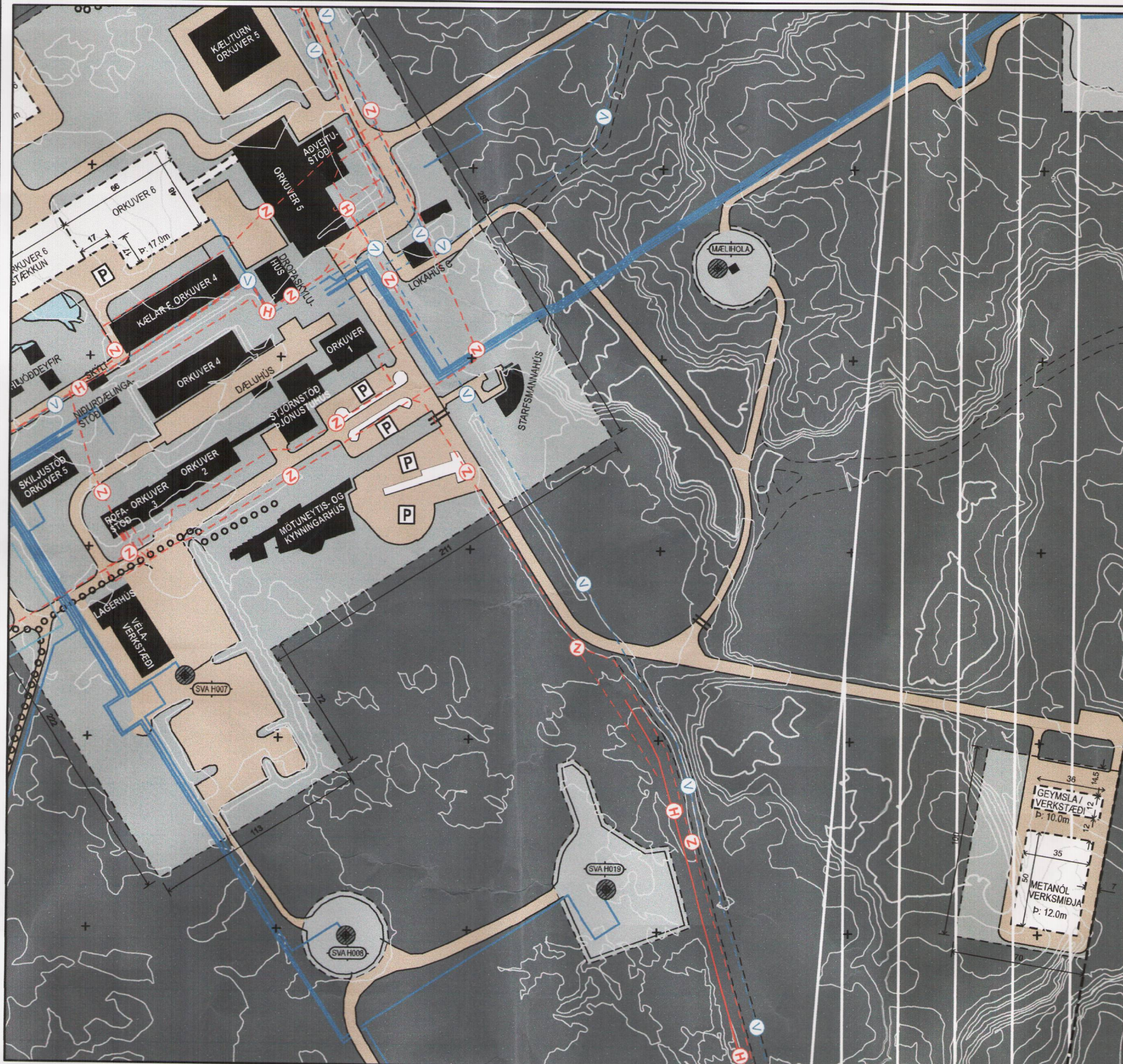
Deiliskipulag í gildi, 1:2500 [A2]