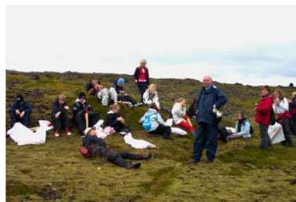
“Stikarar” hvíla lúin bein.

Alls komu um 100 börn í fræðslu í Krossavík á vordögum, um 230 nemendur grunnskólans komu í stjörnuskoðun og auk þess fullorðið fólk og 15 stikuðu gönguleið fyrir Jökul. Alls voru það því um 360 nemendur skólans og aðrir sem nutu sérstakrar dagskrár sem þjóðgarðurinn bauð uppá.