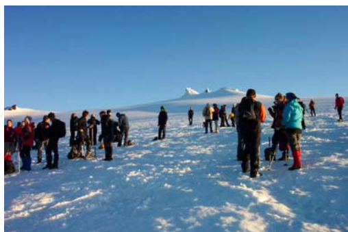
Jónsmessunæturanga á Snæfellsjökul.