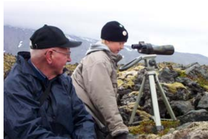
Beðið eftir rebba.