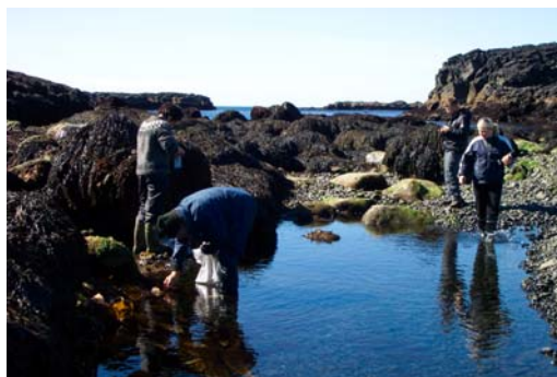
Vísindamenn og landverðir í fjörunnarsóknum við Malarrif.