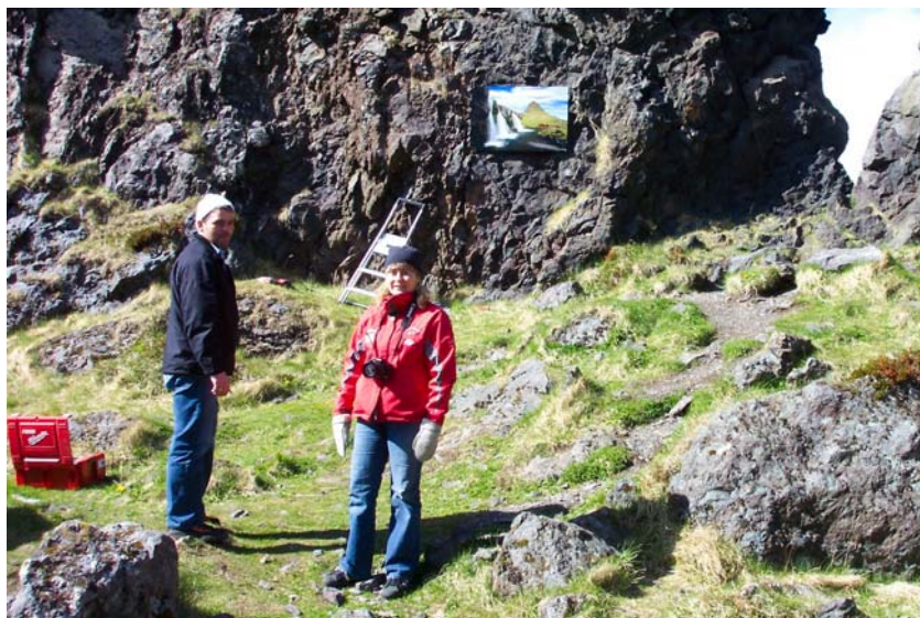
Ljósmyndir voru festar á klettaveggi á Djúpalónssandi.

HSH valdi Hreggnasa sem eitt af fjöllum fjölskyldunnar sumarið 2007. Er þetta samstarfsverkefni UMFÍ "Fjölskyldan á fjallið". Gengu 15 manns á fjallið þann 7. júní og komu gestabók fyrir.