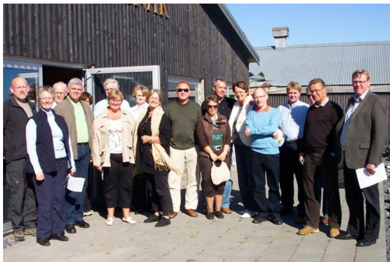
Forsætisnefnd Alþingis á ferð.