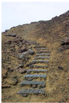
Tröppur á Saxhóli.