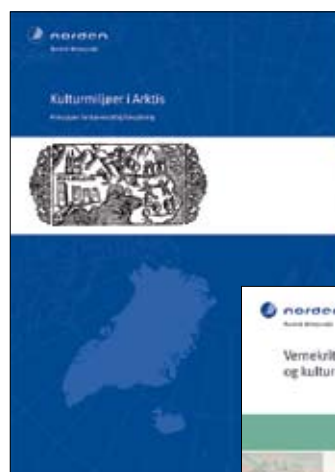
TemaNord 2005:552 Kulturmiljøer i Arktis – principper for bæredygtig forvaltning

Nordisk Ministerråd har øget fokus på bevarelse og beskyttelse af kulturminder og landskaber i de arktiske områder. Øget turisme og friluftsliv betyder mere pres på natur- og kulturminder nogle steder, mens fraflytning andre steder giver behov for at bevare historien. Derfor ser to publikationer på, hvordan både landskaber og kulturminder kan bevares i Arktis, Grønland, Island og Svalbard. Arbejdet er foreløbigt udmøntet i to sæt kriterier for bevarelse af hhv. landskaber og kulturminder. Sikring af natur- og kulturarv indgår, ligesom der tages højde for kundskabsværdien af områderne, samt grundlaget for oplevelse og rekreation i Arktis.