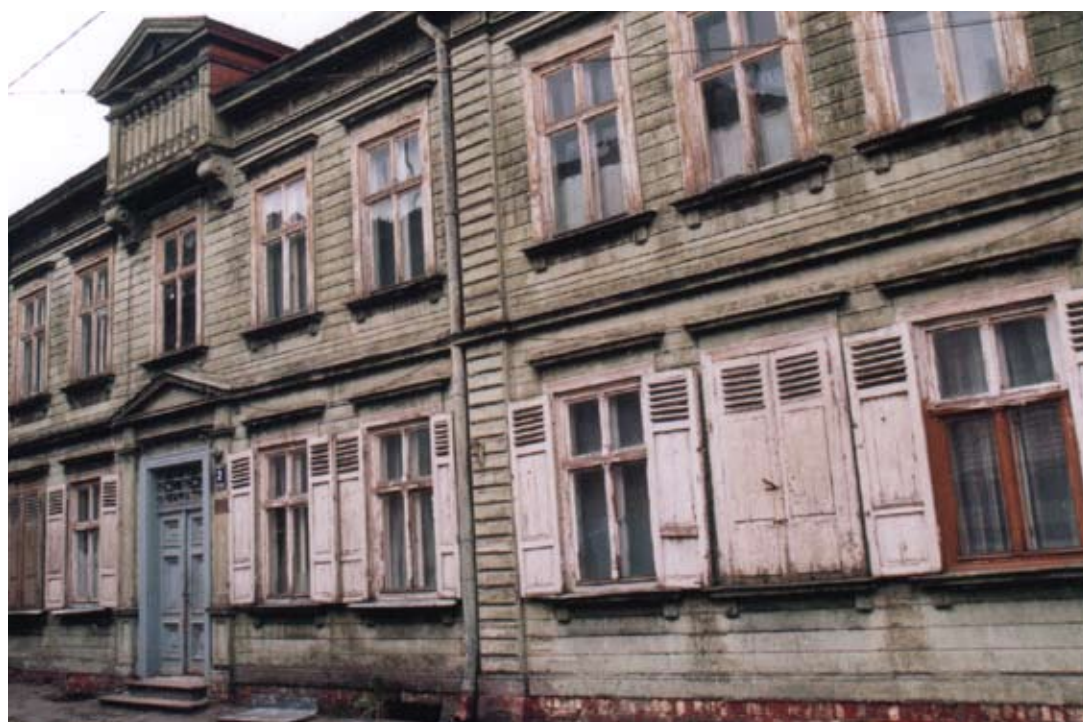
Træhus fra Riga, Letland. Mange baltiske byer har store områder med værdifulde gamle træhuse, men ejerne har kun sjældent de økonomiske midler til at vedligeholde husene. Her er stadig et stort uudnyttet potentiale for bymæssig kvalitet.

Læs mere i ny publikation med vidensopsamling fra workshop, TemaNord 2007:525