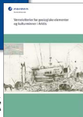
TemaNord 2005:541 Værnekriterier for geologiske elementer og kulturminder i Arktis

Publikationer fra Nordisk Ministerråd kan bestilles på www.norden.org/publikationer